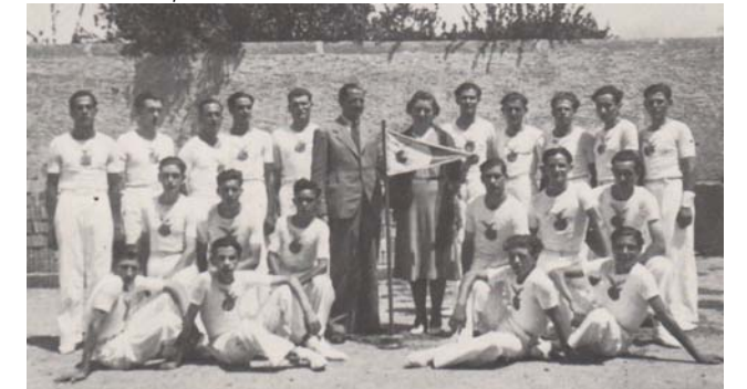
La majoria de dades són extretes del llibre de la història del Centre editat amb motiu del Centenari de l'entitat, celebrat durant el 1980.